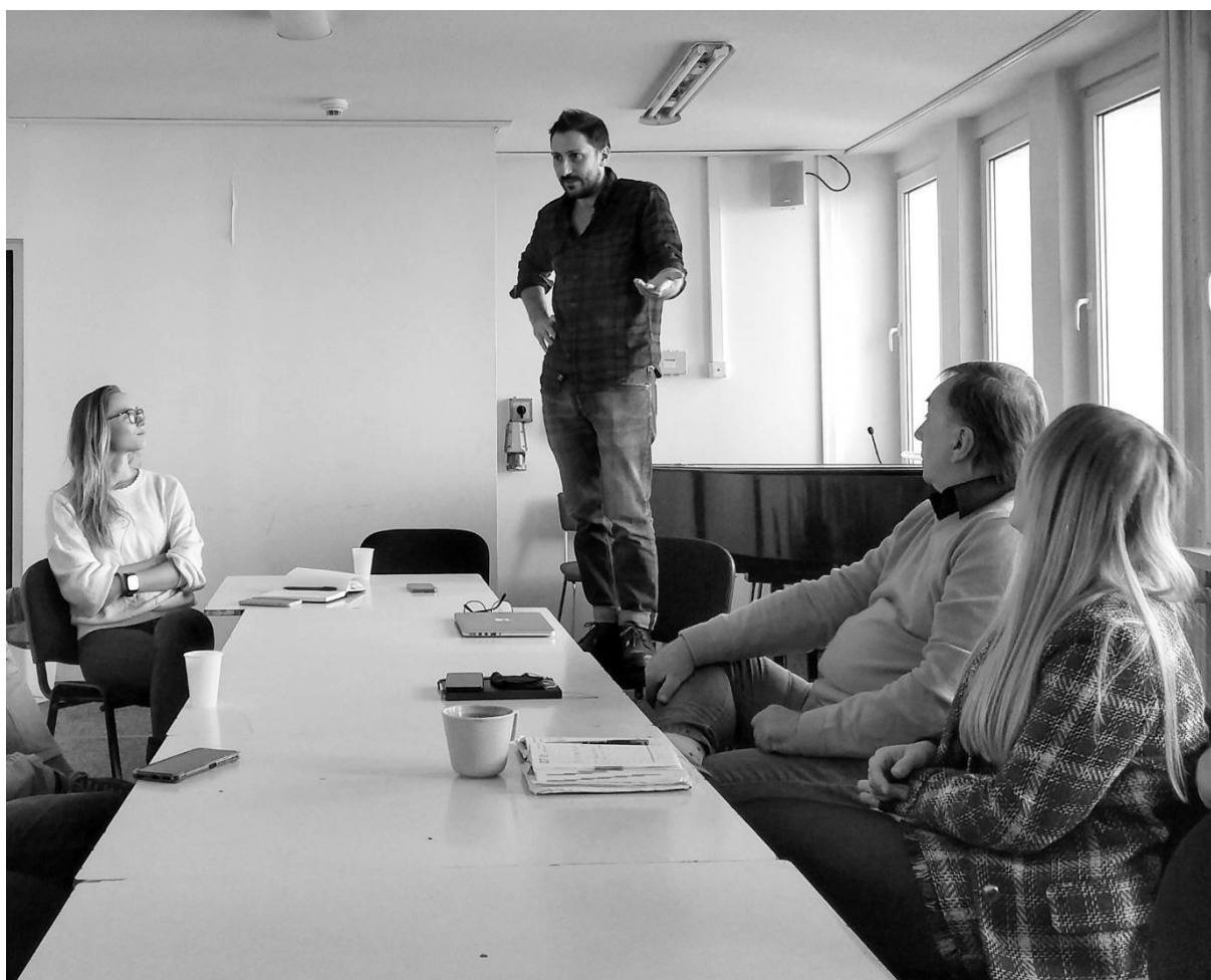
Spotkanie z reżyserem Gianluca Iumiento

Naszym celem jest lepsze poznanie mniejszości, zaproszenie jej w przestrzeń teatru na równych zasadach. Oznacza to, że osoby z mniejszości ukraińskiej i polskiej niezwiązane zawodowo z teatrem będą partnerami scenicznymi profesjonalnych aktorów. Wspólnie stworzą dwa spektakle zainspirowane dramatem Luigiego Pirandella Tak jest, jak się państwu zdaje . By jeszcze lepiej poznać życiowe historie stojące za mniejszością polską mieszkającą w Oslo i mniejszością ukraińską we Wrocławiu, przeprowadzimy profesjonalne badania społeczne. Uzyskane w ten sposób wyniki będą stanowiły inspirację do stworzenia scenariuszy spektakli. Dzięki temu fabuła spektakli oparta będzie na realnych przeżyciach, doświadczeniach i problemach. Będzie prawdziwa, ważna i co najważniejsze – społecznie zaangażowana.