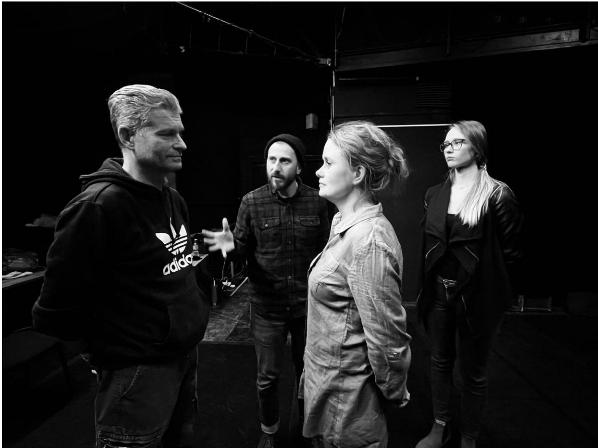
Майстер-класи Джанлуки Юм'єнто з акторами Польського театру у Вроцлаві, фото: Миколай Пливач.