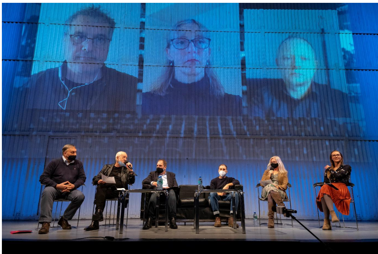
Konferencja Including Minority

Teatr Polski we Wrocławiu otrzymał ponad 1,5 mln złotych na realizację projektu „Including Minority – włączyć mniejszość” w partnerstwie z norweskim niezależnym teatrem Company B. Valiente .