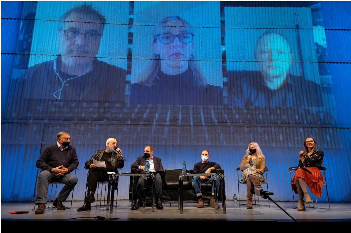
Конференція Включно з меншістю, фото: Ярек Кушмірський

Teatr Polski у Вроцлаві отримав понад 1,5 мільйона злотих на реалізацію проекту « Including Minority – Включно з меншістю » у партнерстві з норвезькою незалежною театральною трупю B. Valiente.